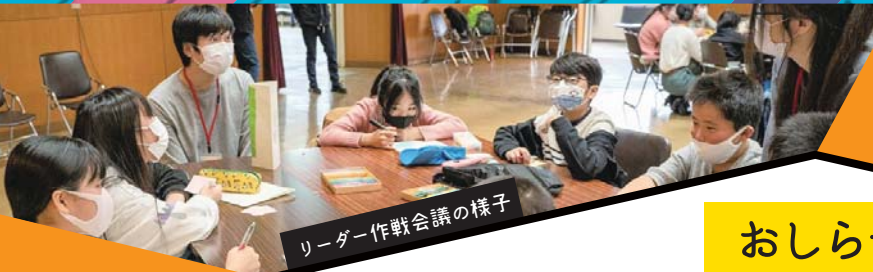
リーダー作戦会議の様子